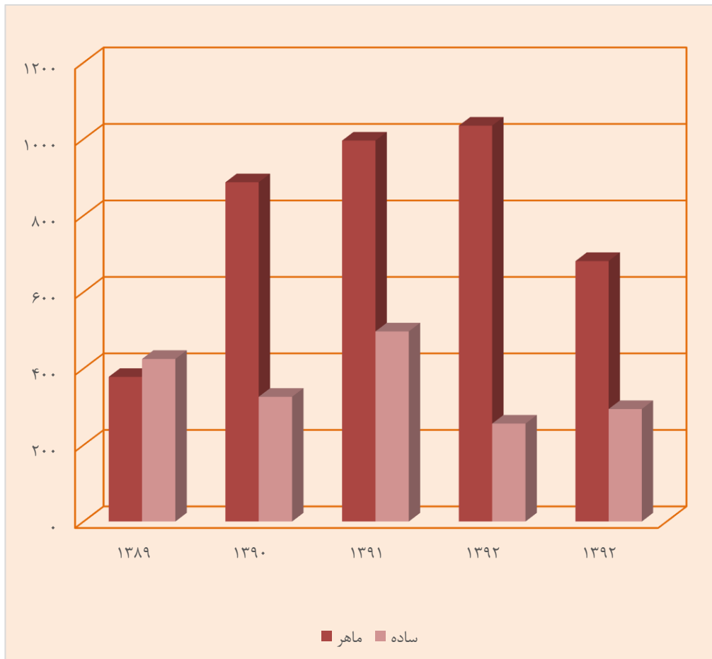
مبنا: جدول ۳-۵